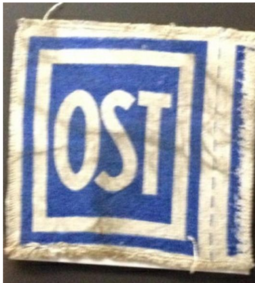
Kennzeichen für die Zwangsarbeiter aus der UdSSR 10

Das „OST“ 9 kann man eben nicht oft genug betonen: