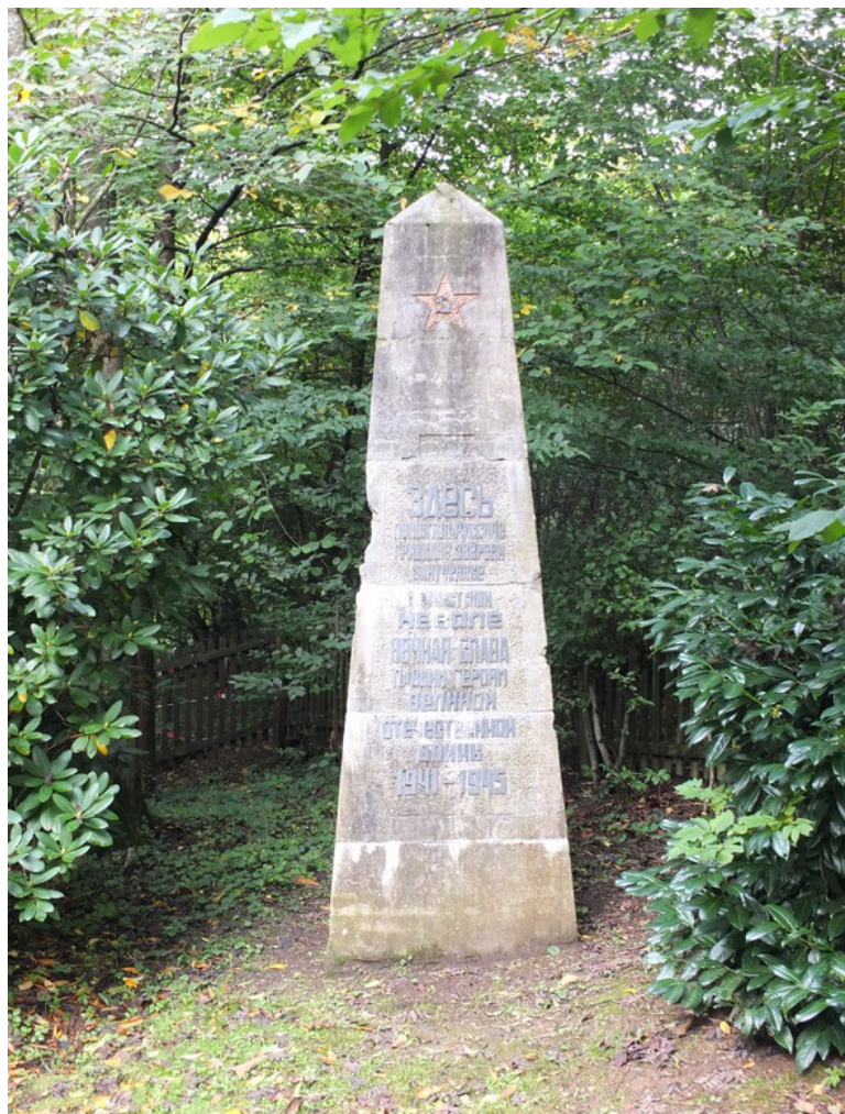
Die von drei Seiten auf Russisch, English und Deutsch beschriftete Stele im September 2017