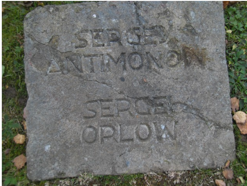
Grabstein Sergey Antimonow, 2015

Immer wieder muß ich an das Schreiben des Innenministers vom 19.8.1950 denken: „Die Forderung des Landkommissars zur Aufstellung von Grabzeichen auf sowjetischen Gräbern in einer Größe von 60 x 90 cm geht auf eine Vereinbarung zwischen der britischen Besatzungsbehörde und den russischen Verbindungsstellen zurück. Ich habe mich wiederholt gegen dieses Verlangen ausgesprochen und es abgelehnt, eine entsprechende Weisung an die nachgeordnete Behörden zu geben und zwar aus dem Grunde, weil dieses Verlangen nicht dem Grundsatz einer gleichmässigen Behandlung sowohl hinsichtlich der Ausstattung als auch der Kostenaufwendung aller Kriegsgräber ohne Rücksicht der Nationalität entspricht. Eine Heraushebung der russischen Gräber gegenüber allen anderen Kriegsgräbern würde von der Bevölkerung nicht verstanden werden und wäre geeignet, einer politischen Propaganda Vorschub zu leisten.“ 27