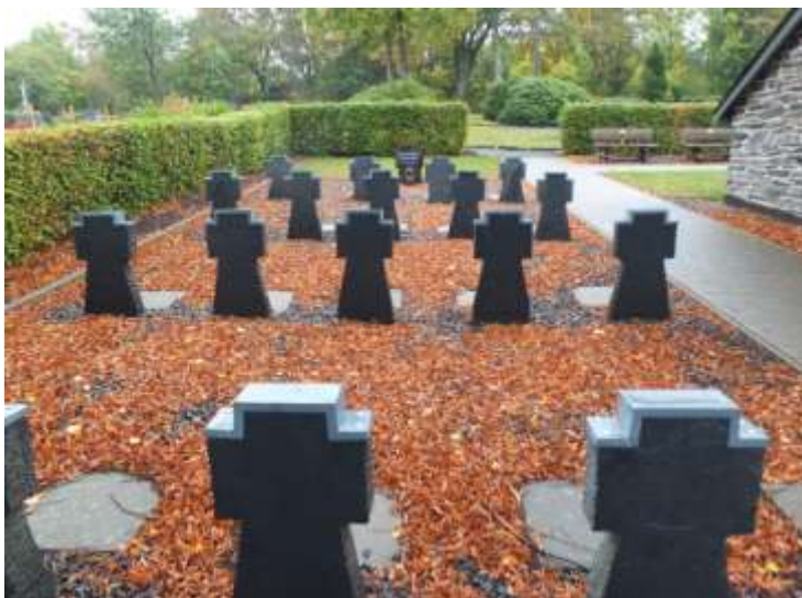
Erster Blick beim Betreten des Friedhofs

Auffälligerweise braucht man sich um Grabsteine deutscher Soldaten gar nicht so viele Gedanken zu machen. Oft stehen sie sehr aufrecht – wie in Siedlinghausen 37