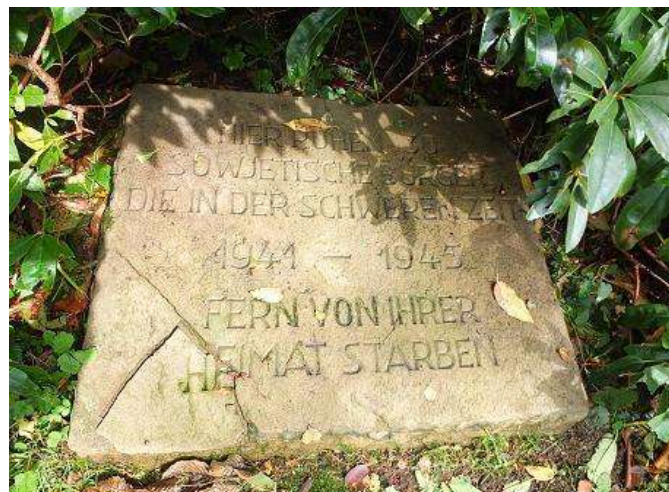
„Hier ruhen 30 sowjetische Bürger, die in der schweren Zeit 1941 – 45 fern von ihrer Heimat starben.“ 40