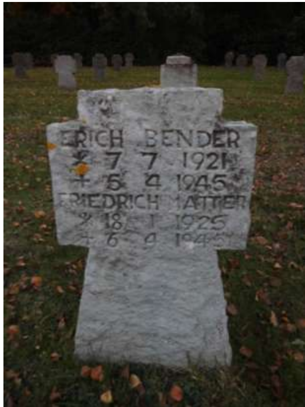
Zwei Namen mit Geburts- und Todestag auf dem Soldatenfriedhof in Eversberg