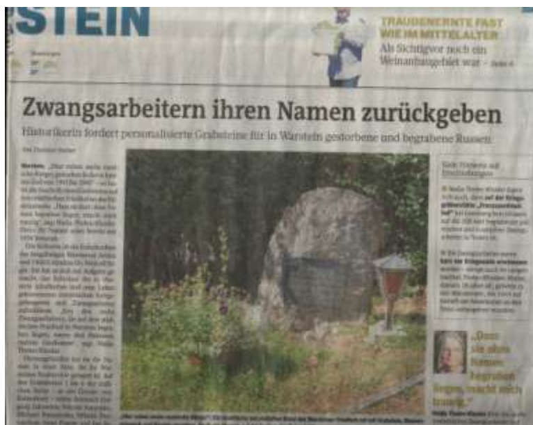
„Westfalenpost“ vom 9.8.2018 13