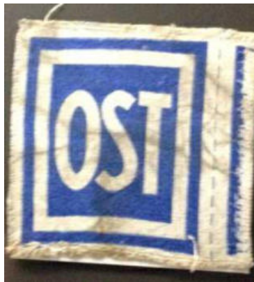
Kennzeichen „OST“ für Zwangsarbeiter*innen aus der Sowjetunion 46 „Gleichsetzung der Arbeitskräfte aus dem altsowjetrussischen Gebiet mit Kriegsgefangenen“ 47

Es muß schrecklich weh tun, immer die gleichen Fehler zu sehen, und ich bitte vielmals um Entschuldigung, daß ich zu diesem Schmerz beitrage. Ich kann nur tun, was ich kann, und mehr kann ich nicht tun. Die Toten, die Überlebenden und die Angehörigen mögen mir verzeihen!