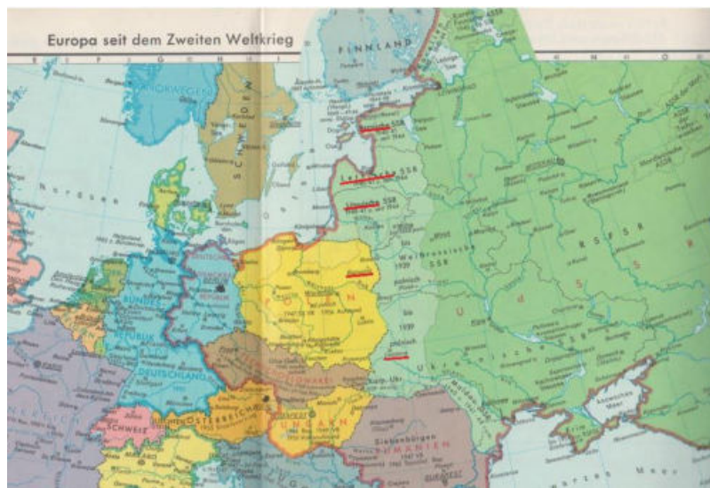
„Bialystok“ in F.W. Putzger, Historischer Weltatlas , Berlin 1970.

2. die Methode, die im Durchgangslager Bialistok angewandt wird. Sonderabdrucke sind vom Arbeitsamt Meschede oder von hier anzufordern. Die Behandlung kann nach den Anweisungen im Lager erfolgen. Somit sind die Aufnahmen in unsere deutschen Krankenhäuser nicht mehr erforderlich. Von dem Mittel Meriphen können hier Probemittel angefordert werden.“ 45