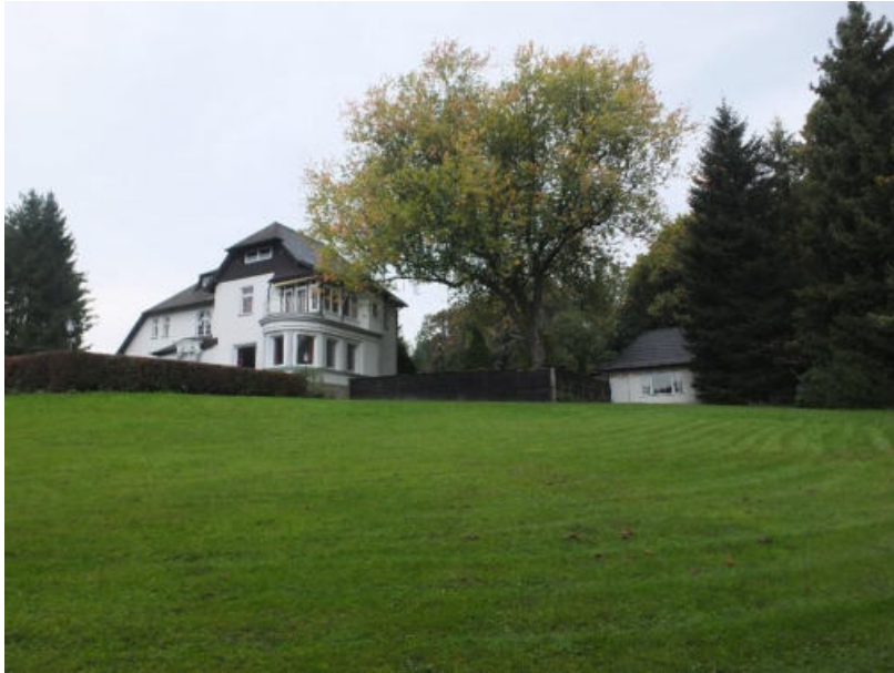
„Villa Klönne“, heute „Lemmervilla“ 18